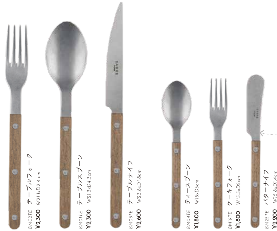
BM02TE テーブルフォーク W21.1xD2.4 cm ¥2,300 BM01TE テーブルスプーン W21.3xD4.3cm ¥2,300 BM03TE テーブルナイフ W23.8xD1.8cm ¥2,600 BM04TE ティースプーン W15xD3cm ¥1,800 BM19TE ケーキフォーク W15.5xD2cm ¥1,800 BM25TE バターナイフ W15.8xD1.4cm ¥2,000