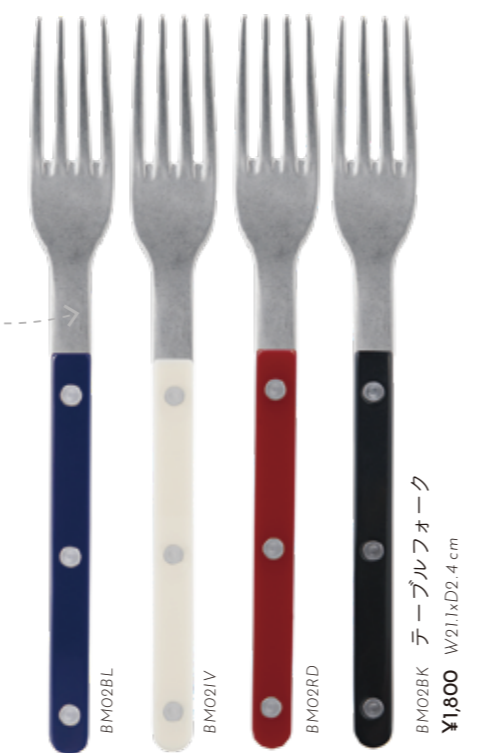
BM02BK テーブルフォーク W21.1xD2.4 cm ¥1,800