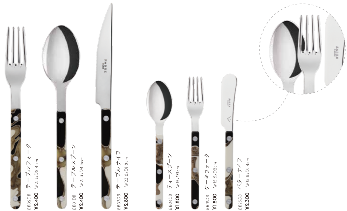
BB02DB テーブルフォーク ¥2,400 W21.1xD2.4 cm