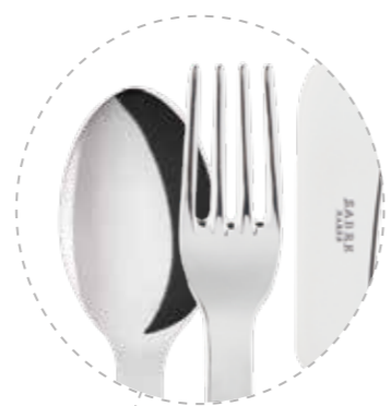
BB25DB バターナイフ ¥2,300 W15.6xD1.4cm