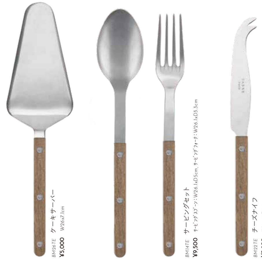
BM16TE ケーキサーバー W26x7.1cm ¥5,000 BM14TE サービングセット W26.1xD5cm, #セパレーター:W26.1xD3.3cm ¥9,500 BM20TE チーズナイフ W24.3xD2.1cm ¥3,800