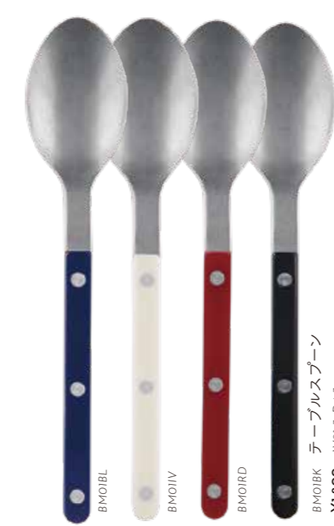
BM01BK テーブルスプーン W21.3xD4.3cm ¥1,800