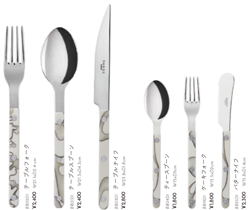
BB02DI テーブルフォーク ¥2,400 W21.1xD2.4 cm