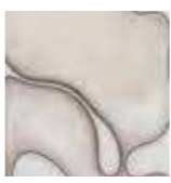
BB22DI チーズナイフ ¥3,800 W24.3xD2.1cm