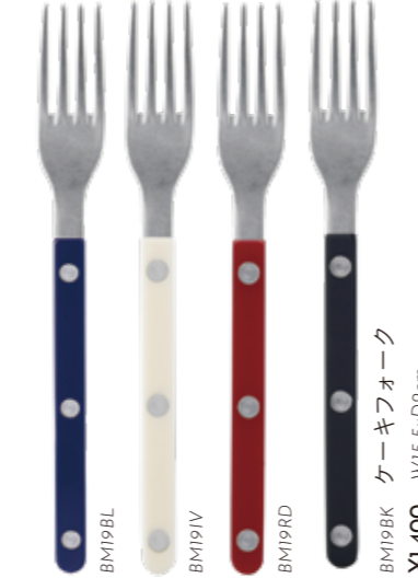
BM19BK ケーキフォーク W15.5xD2cm ¥1,400