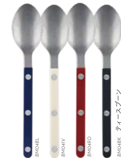
BM04BK ティースプーン W15xD3cm ¥1,400