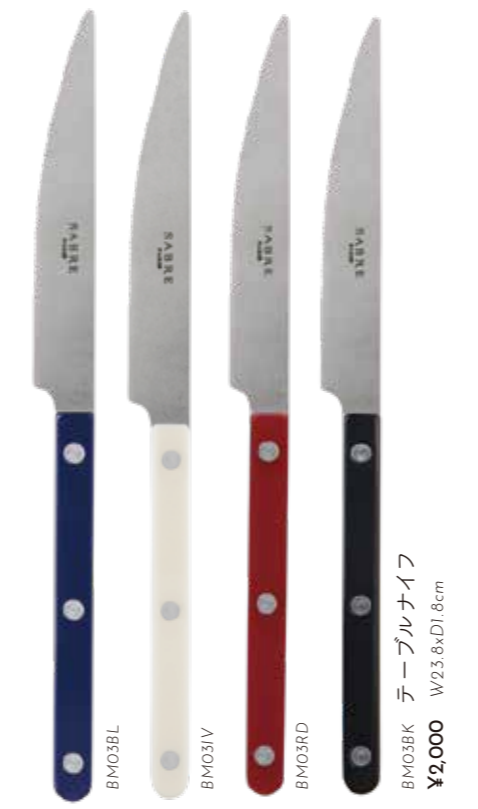
BM03BK テーブルナイフ W23.8xD1.8cm ¥2,000