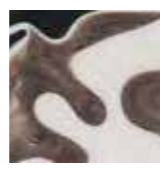
BB22DB チーズナイフ ¥3,800 W24.3xD2.1cm