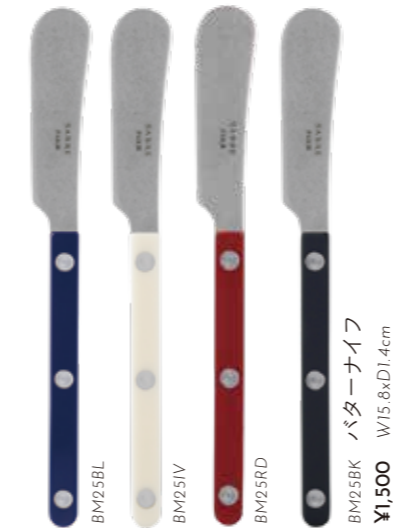
BM25BK バターナイフ W15.8xD1.4cm ¥1,500