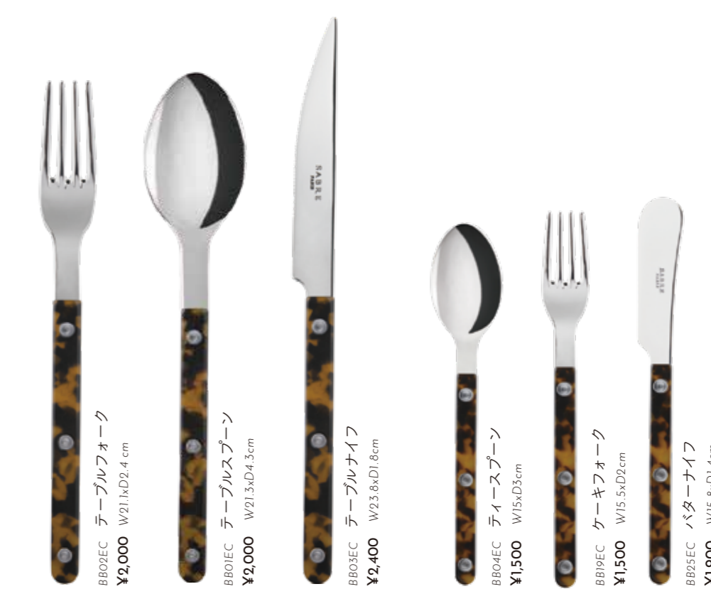
BB02EC テーブルフォーク ¥2,000 W21.1xD2.4 cm